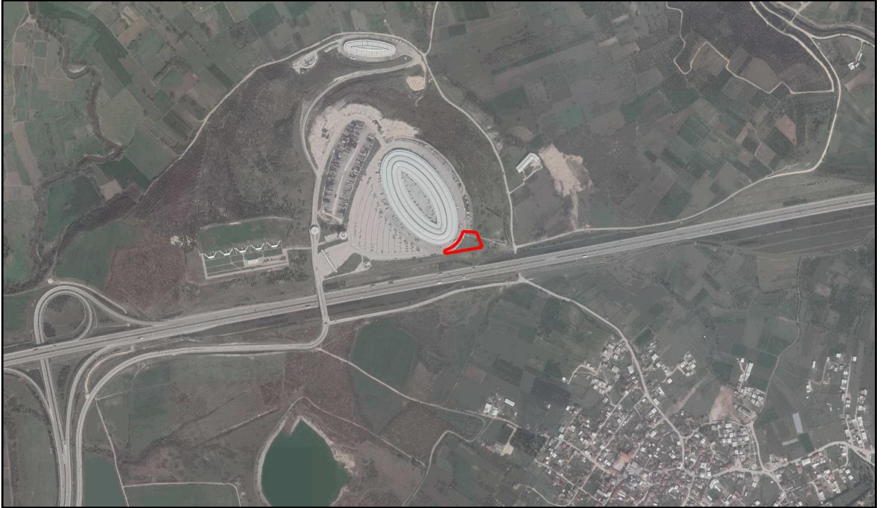
Planlama Alanı Konumu

Plan değişikliğine konu parsel Bursa İli, Nilüfer İlçesi, Yolçatı Mahallesi sınırlarında yer alan, Bursa-İzmir Otoyolunun yaklaşık 100 metre kuzeyinde, Bursa Büyükşehir Belediyesi Hikmet Şahin Kent Hali'nin güneydoğusunda konumlanmaktadır.